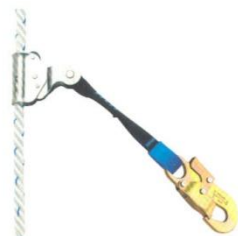
stopfor® P 0,3-41-15-41 (mit 15 m Führungsseil)