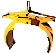
Rohrgreifer zum horizontalen Transport