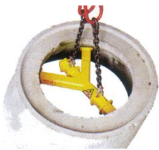
Traverse für konische Betonrohre