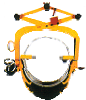
Fassgreifer zum Heben- und Kippen halbautomatisch automatisch auto. mit Handrad