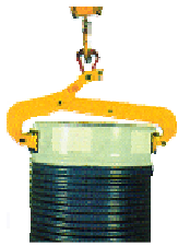
Halbautomatischer Fassgreifer für stehende Fässer