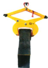
Greifer zum Heben- und Wenden von Lasten mit parallelen Flächen