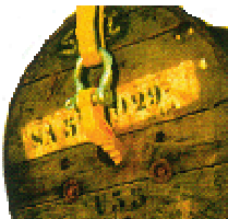
Haken für Kabeltrommel nur paarweise einsetzen