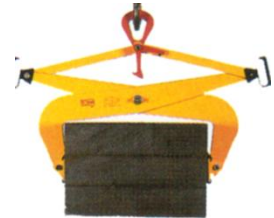
Greifer für Lasten mit parallelen Flächen mit Gummibeschichtung