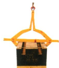
Einstellbarer Block-Greifer mit gummibeschichteten Greifbacken